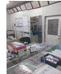
事務室アクリル板 検温器