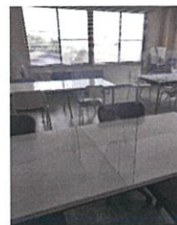
食堂パーティション