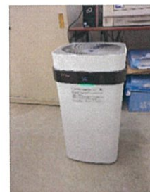
ウイルス対応の空気清浄機設置